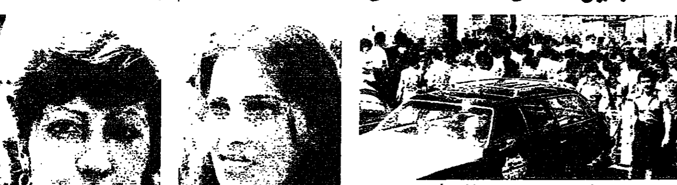
الطلاب امام احد مراكز الامتحانات